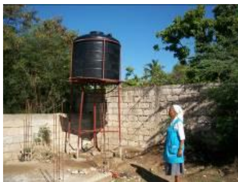
Installation d'une citerne