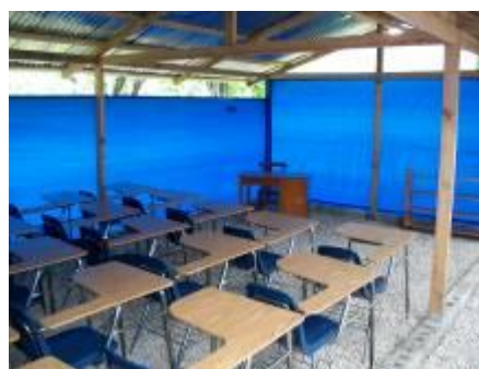
Une salle de classe