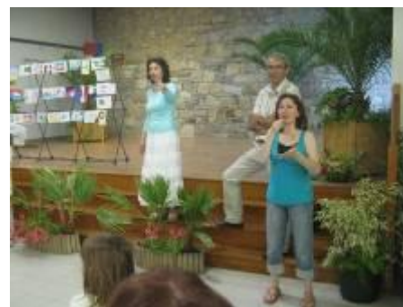
Début de la journée