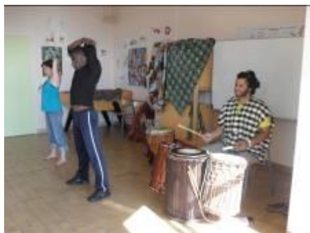
Atelier danse africaine