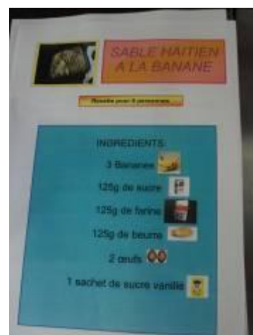
Recette d'un gâteau haïtien