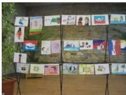
Les dessins du concours