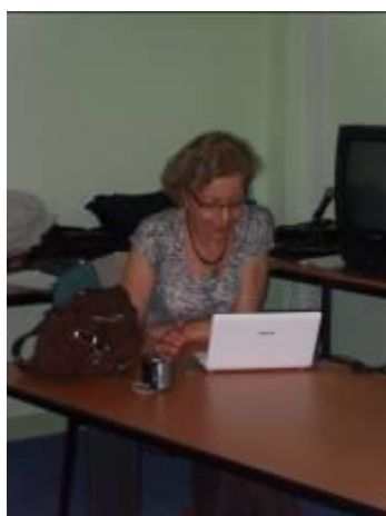
Conférence SOS ESF