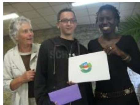
Remise du 1 er prix