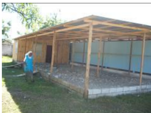
Atelier des garçons