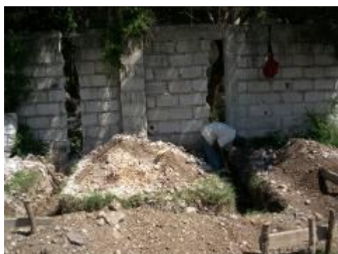
Arrivée d'eau potable